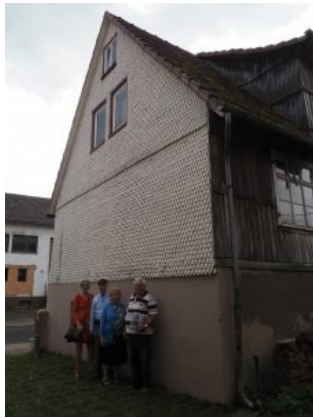
Vor der ehemaligen, jetzt baufälligen Synagoge von Ulmbach.