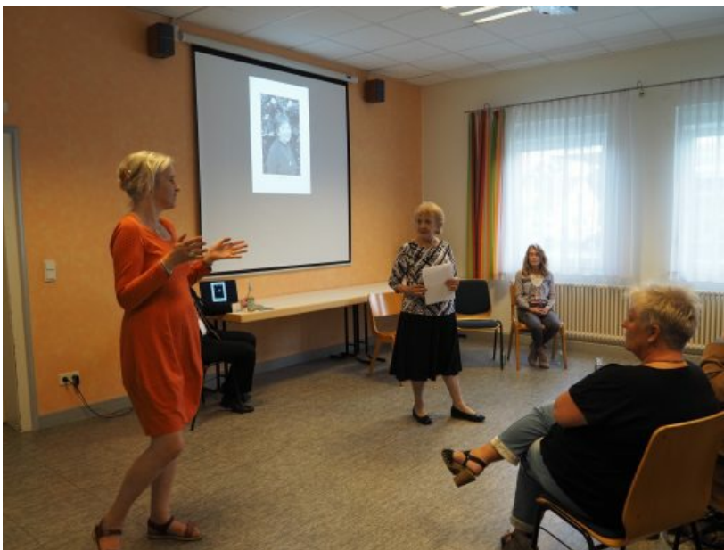
Die Autorin, umrahmt von ihren beiden Übersetzerinnen.