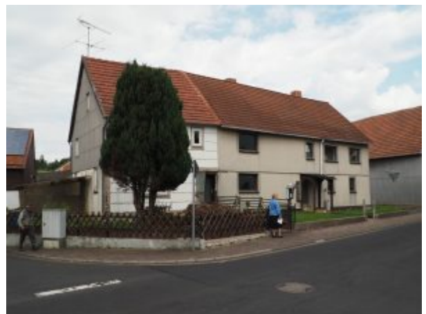
Der linke Teil des Hauses gehörte Onkel Salli.

Vor jedem ehemals jüdischen Wohn- oder Geschäftshaus oder Grundstück bleibt unsere kleine Delegation stehen, auch vor dem der anderen Familie Maier Nußbaum und vor der baufälligen Synagoge, einem verschindelten, maroden Fachwerkhaus, dessen Tage gezählt sind. Einige Häuser sind längst abgerissen. Auch von dem jüdischen Kaufhaus, einem Fachwerkbau, ist nichts mehr zu sehen. Die katholische Kirche hat das Gebäude seinerzeit gekauft, Nonnen aus einem der Kloster lebten und arbeiteten eine Zeitlang dort. Heute spielen Kinder aus dem Flüchtlingswohnheim gegenüber auf der umzäunten Brache, im hohem Gras, unter gigantischen Sonnenblumen. Ruth Stern Gasten macht sich Notizen. Sie brennt darauf, endlich ihr Großelternhaus zu sehen. Oder das, was davon übrig ist, nachdem Mietnomaden weitergezogen sind.