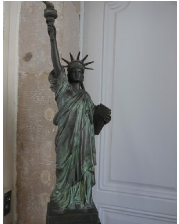
Die Freiheit erleuchtet die Welt“ von Auguste Bartholdi. Ein Geschenk des französischen an das US-amerikanische Volk. Der Monumentalbildhauer aus dem Elsass war Jude. In Colmar erinnert ein Museum an ihn.